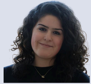
Gurtner Chiara Schreibteam Gestaltung/Styling Gestaltung des Flyer/Programmheft