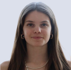
Doppelhofer Elin Schauspiel: Schülerin Tanzen