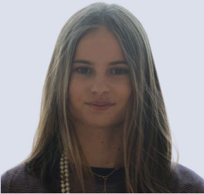
Andrey Lyne Schreibteam Gestaltung/Styling Lichttechnik