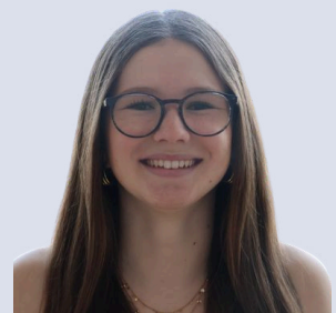
Fasel Leonie Schauspiel: Schülerin Tanzen