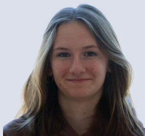
Jelk Raphaela Schreibteam Gestaltung/Styling