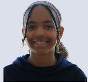
Mooser Megane Schauspiel: Vivi Tanzen