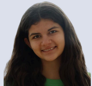
Peneva Darya Schauspiel: Schülerin Tanzen