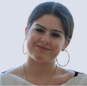
Gurtner Elina Schreibteam Gestaltung/Styling Gestaltung des Flyer/Programmheft