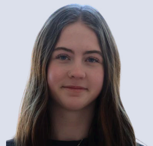
Rappo Anouk Gestaltung/Styling Tanzen