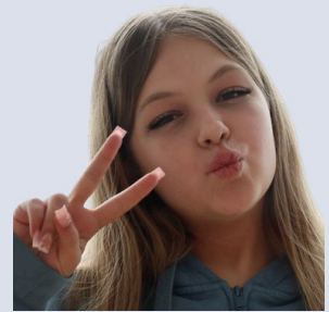
Blum Heddy Gestaltung/Styling Gesang Thriller - Michael Jackson