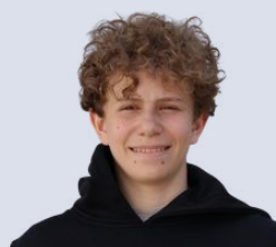
Rotunno Nevio Gitarre