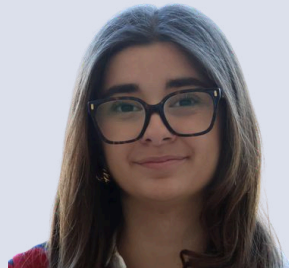
Mustafai Greta Schreibteam Gestaltung/Styling